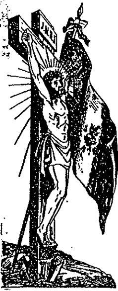
« Vive le Christ qui aime les Français ! « Vive le Sacré-Cœur notre espoir et notre salut ! »