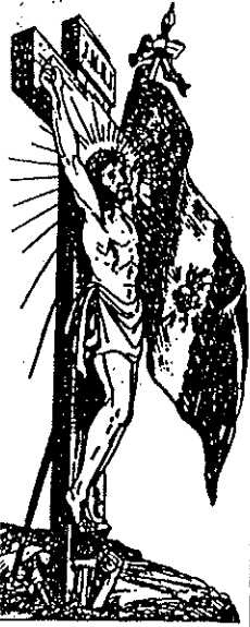
Plus le Christ qui aime les Français ! Plus le Sacré-Cœur nous aime et nous aime !

ABONNEMENTS DIRECTS (servi par la Poste) 2 Jura et départements limitrophes... un an : 12 fr. ; 6 mois : 6 fr. 50 ; 3 mois : 3 fr. 50 Départements non limitrophes... un an : 12 fr. ; 6 mois : 6 fr. ; 3 mois : 3 fr. Strasbourg (Union postale)... un an : 12 fr. ; 6 mois : 6 fr. ; 3 mois : 3 fr. Espagne (Ours de l'Union postale) un an : 14 fr. ; 6 mois : 7 fr. ; 3 mois : 3 fr. L'abonnement se paie d'avance Toute demande de changement d'adresse doit être accompagnée de UN FRANC